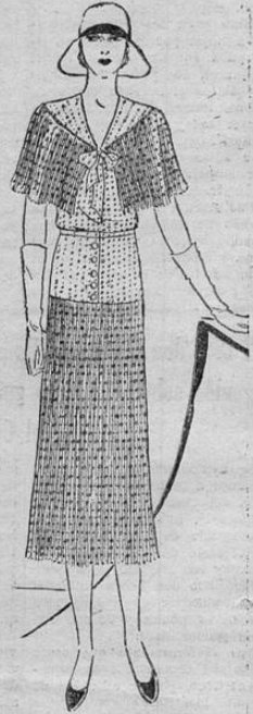
Bello modelo de crepé rosado. Nótese la originalidad del corte, que une a su sencillez una gran distinción